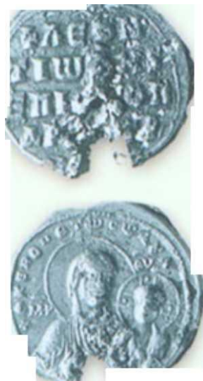
Печат на Дриста

Мирният договор не бил I приет еднозначно в средите на българските боляри. Сформирала се партия на несъгласни с политиката на мир с Византийската империя. Още през 928 г. недоволните велможи заедно с брата на цар Петър, Иван, направили заговор с цел да завземат властта. Заговорът обаче бил разкрит и обезвреден. Съгласно сведенията на византийските хронисти Иван е бил хвърлен в затвора и (според някои източници) замонашен насила. Съществуват предположения, че за кратко време Иван дори е бил провъзгласен за цар. Те се основават на два исторически паметника. Първият от тях е един от надписите (X в.) от скалния манастир Мурфатлар (Северна Добруджа), на който се чете името на цар Иван. Другият артефакт е личен оловен печат на Иван, на който е изписано на гръцки „василевс“, т. е. Цар 18. Византийските хронисти разказват, че пратеници на императора успели тайно да изведат Иван от тъмницата и да го отведат в Константинопол. Там той бил венчан тържествено за една знатна арменка, като кум му станал самият император, и бил причислен към византийската знат. Такова тълкуване на фактите обаче някои историци смятат за плод на естествените патриотични нагласи на хронистите. Едва ли най-опасният за този политически момент затворник е бил така слабо охраняван, че да може да бъде лесно изведен от тъмницата, извън града и дори извън страната, без никой да го потърси през цялото това време.