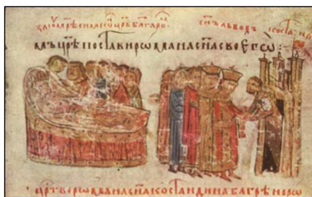
Смъртта на свети цар Петър. Миниатюра от Ватиканския препис на Манасиевата летопис.

Предполага се, че той е съставителят на известен брой прекрасни поучения с нравоучителен характер, чийто автор именува себе си „Петър монах“, „Петър цар“, „Петър някой си“, „Петър черноризец“, „Петър недостойний“. Познати са следните творби, които съдържат в заглавието си авторското име Петър: 1. „Сказание за поста, за молитвата и за църковния чин“; 2. „Поучение за душевното спасение“; 3. „Слово за временния живот“; 4. „Слово за всяко съпротивление“; 5. „Слово за този живот“; 6. „Слово за богатия и бедния“; 7. „Молитва към Света Богородица“. Засега за безспорно негови слова се смятат първите четири.