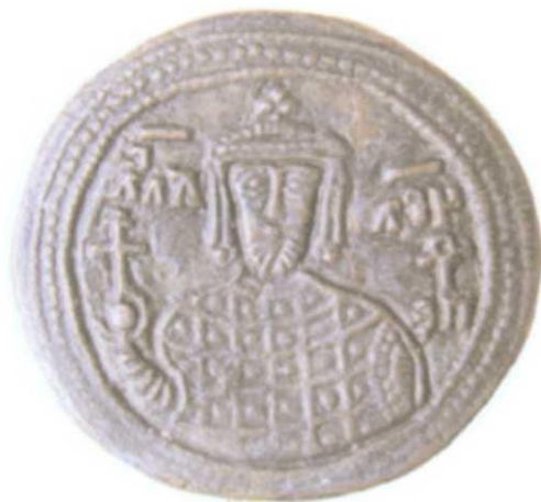
Печат на свети цар Петър

престолонаследникът внезапно умрял, което осуетило плановете им. Въстаниците преминали през границата, опустошили земите по устието на р. Струма, насочили се на запад към Епир и там причинили големи беди на мирното население, така че се наложило византийското правителство да ги усмири; те били поселени по бреговете на Артския залив. И в този случай преблагият Бог, виждайки сърдечното разположение на благочестивия цар Петър, не допуснал да се стигне до проливане на братска кръв.