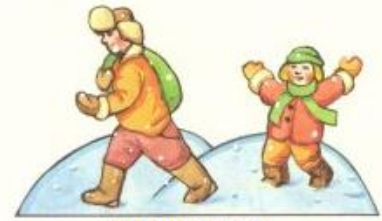
Деца пеещи рождественски песни

За да сглобиш играчките за елхата, разбира се, имаш нужда от: ножици, лепило, линейка, игла с конец. Работи предпазливо с лепилото, без да зацапваш. След като сглобиш играчките по показаната схема, вземи игла и конец и го промуши внимателно в червените точки. Постави готовата играчка на елхата.