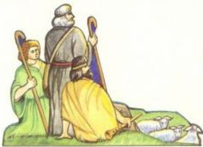
Благовестие на пастирите