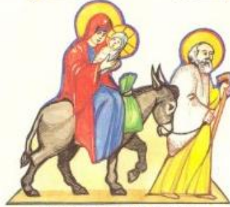
Бягство в Египет